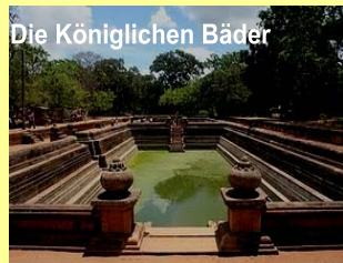
Die Königlichen Bäder

am 13. August 2010 ging es los. Es war ein glücklicher Tag für die Kinder. Wie geplant stiegen alle Waisenkinder und Betreuer in den wartenden Bus, alle waren fröhlich und die Vögel zwitscherten uns ein Lied. Es war ein klarer schöner